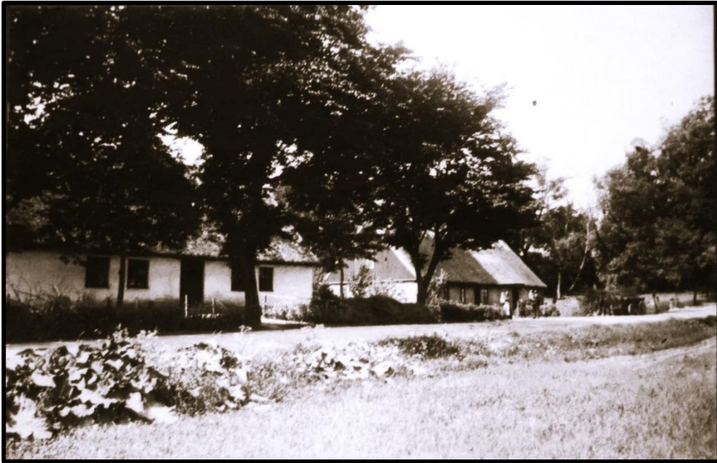
Elevbostaden och Kulturhuset i Gärdslöv

Det är att göra en god gärning utan att tänka på att det är en god gärning.