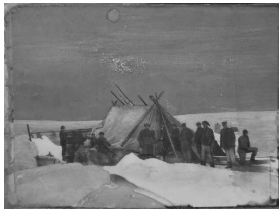
Första lägret ute på packisen den 12 februari 1903.

Efter att ha drivit i isen i mer än en månad och fartyget fått ett flertal törnar av isen var kampen slut. Kl. 08.00 samlades alla på däck för att utbringa en skål till fartyget och strax efter gick man ut på ett isflak där man samlat så mycket som möjligt med mat och förråd samt tre båtar. Från isflaket betraktade man med sorg sitt fartyg sakta försvinna kl. 12.45. Det sista man såg av fartyget innan hon slukades av havet var K.S.S.S. flagga som satt på toppen av stormasten. Märkligt nog var det inte panik som drabbade männen utan man satte upp ett tält med ett segel som bärgats, värmda mat och sedan underhölls man av dragspel och sång. Kanske en befrielse att kampen om att rädda fartyget var slut och nu visste man att fartyget aldrig skulle ta dem tillbaka till civilisationen. Nya utmaningar stod framför 20 män som nu tvingades ta sig an element som numera skulle beskrivas som ohanterbara.