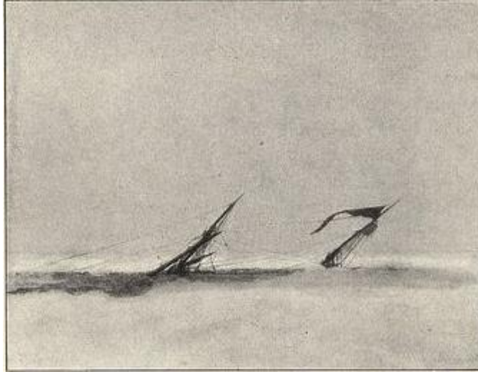
Sista synen av ANTARTIC.

Under tiden i försöken att nå Snow Hill sjövägen med ANTARCTIC fastnade fartyget redan i början av januari i drivisen för att slutligen se hur expeditionsfartyget skruvades ner i Weddellhavets is och sjönk den 12 februari 1903. I dagböckerna skildrar flera av de ombordvarande hur tiden januari-februari var en resa mellan hopp och förtvivlan som pågick då man satt fast i isen.